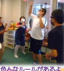
ふうせんバレーも、色々なルールがあるよ