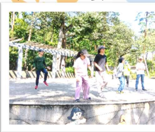
広場のステージでノリノリのダンスを披露

動物園では、ちょうどカピバラやアライグマがお食事タイムになり、食べる姿に癒されました。