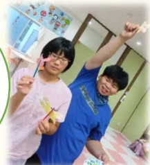
コーヒーフィルターで、にじみ絵遊びをした物を使って作ったトンボ